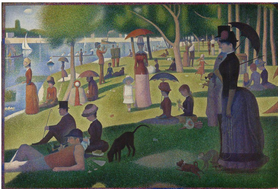
George Seurat, Una domenica pomeriggio all'isola della Grande-jatte, 1889