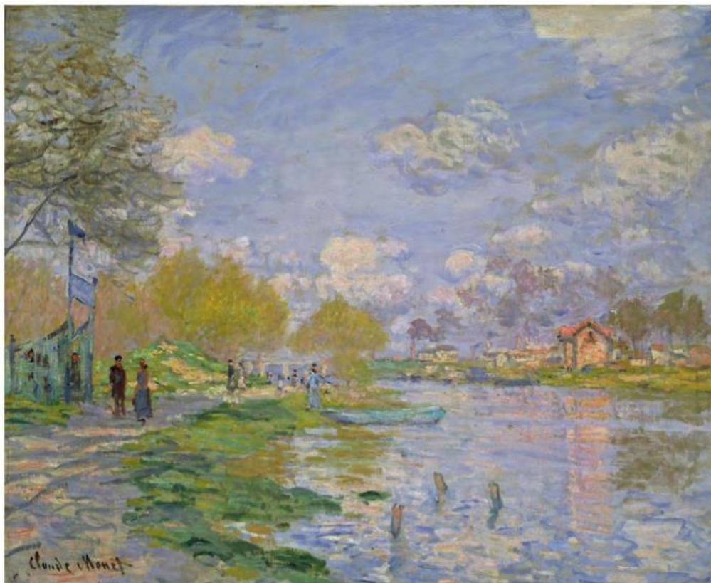
Claude Monet, PRIMAVERA SULL'ISOLA DELLA GRANDE-JATTE, 1879