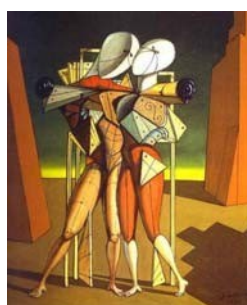
G. DE CHIRICO, Ettore e Andromaca , 1917