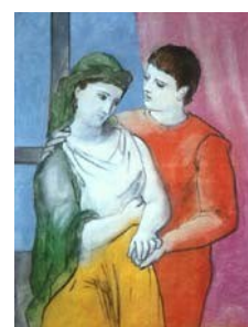
P. PICASSO, Gli amanti , 1923

«Tra l'altre distinzioni e privilegi che le erano stati concessi, per compensarla di non poter esser badessa, c'era anche quello di stare in un quartiere a parte. Quel lato del monastero era contiguo a una casa abitata da un giovine, scellerato di professione, uno de' tanti, che, in que' tempi, e co' loro sgherri, e con l'alleanze d'altri scellerati, potevano, fino a un certo segno, ridersi della forza pubblica e delle leggi. Il nostro manoscritto lo nomina Egidio, senza parlar del casato. Costui, da una sua finestrina che dominava un cortiletto di quel quartiere, avendo veduta Gertrude qualche volta passare o girandolar lì, per ozio, allettato anzi che atterrito dai pericoli e dall'empietà dell'impresa, un giorno osò rivolgerle il discorso. La sventurata rispose.»